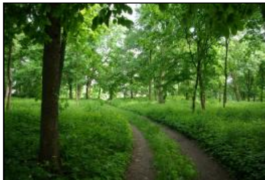
Fot.85-86. Park w zespole dworskim w Starym Kłudnie