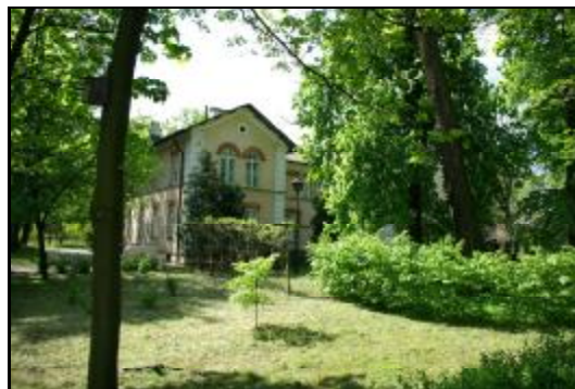
Fot.11-12 Dawny dworzec kolei warszawsko-wiedeńskiej w Grodzisku Mazowieckim