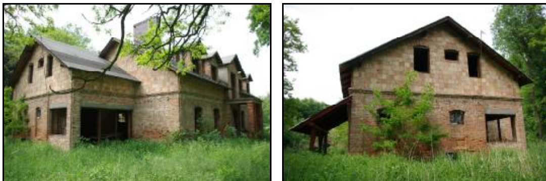
Fot.23-24. Stajnia w zespole willowym „Kaprys” w Grodzisku Mazowieckim