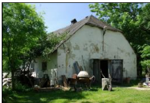
Fot.83-84. Stajnia w zespole dworskim w Radoniach