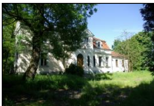
Fot.47-48. Dwór w zespole dworskim w Chlewni