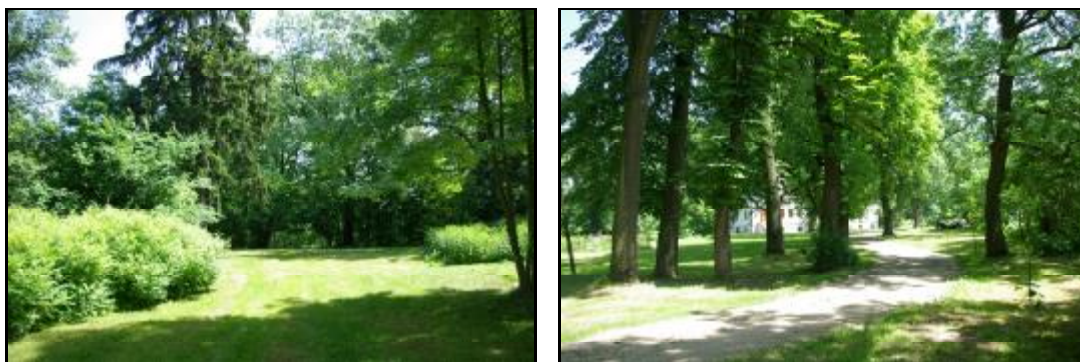
Fot.81-82. Park w zespole dworskim w Radoniach