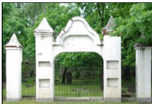
Fot.9-10. Brama przy cmentarzu żydowskim w Grodzisku Mazowieckim