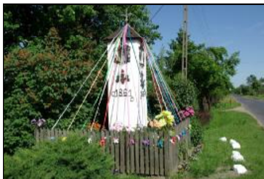
Fot.101. Kapliczka przydrożna w Chlebni

Kapliczka przydrożna w Chlebni została wystawiona w 1861 roku. Jest murowana o konstrukcji słupowej. Posiada cztery wnęki, w których umieszczone były rzeźby ludowe. Do rejestru zabytków wpisano następujące rzeźby: Matki Boskiej Skępskiej, Chrystusa Zmartwychwstałego i św. Floriana.