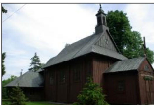
Fot.87-88. Kościół p.w. Przemienienia Pańskiego w Żukowie