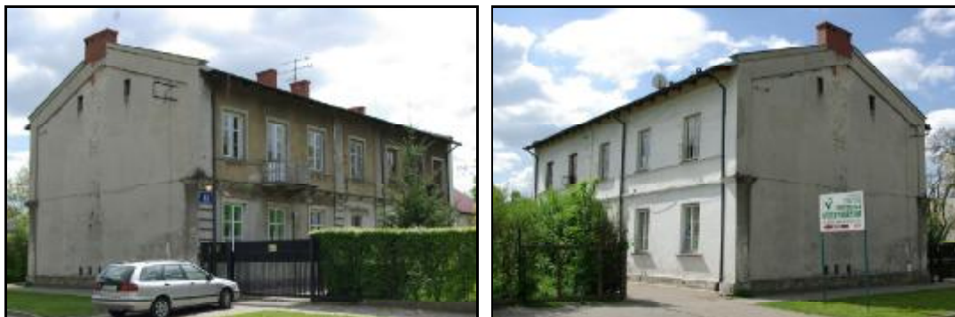
Fot.17-18. Dom z ogrodem przy ul. Kilińskiego 12 w Grodzisku Mazowieckim