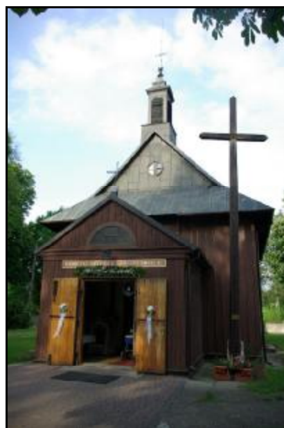
Fot.85-86. Kościół p.w. Przemienienia Pańskiego w Żukowie