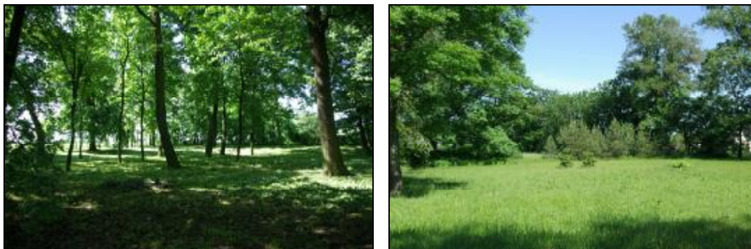
Fot.61-62. Park w zespole dworskim w Izdebnie Kościelnym