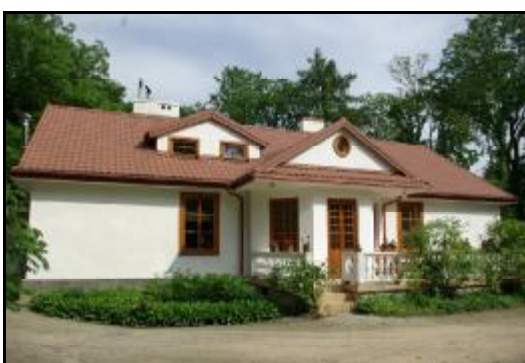
Fot.97-98. Dwór w zespole dworskim w Żukowie