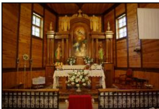
Fot.102. Wnętrze Kościoła. p.w. Zwiastowania Najświętszej Maryi Panny w Izdebnie Kościelnym

Wyposażenie kościoła było neobarokowe. Ołtarze pochodziły z 1924 roku. Obrazy przypisywane autorstwu Józefa Walla to: „Ukrzyżowanie”, „Męczeństwo św. Bonifacego”, „Męczeństwo św. Tekli”. Autorem obrazu „Zwiastowanie” umieszczonego w ołtarzu głównym był Smuglewicz. Ponadto w kościele znajdowały się XVIII-wieczna ambona i chrzcielnica.