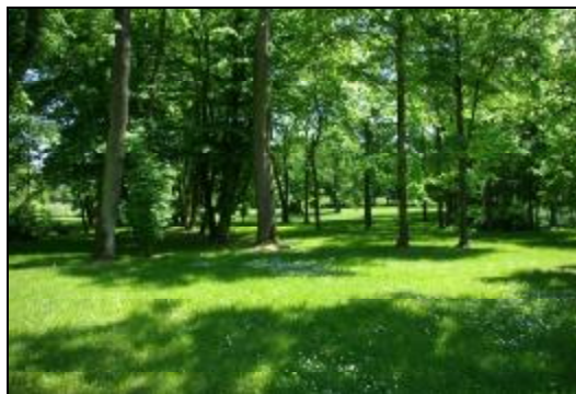
Fot.73-74. Park w zespole dworskim w Opypach