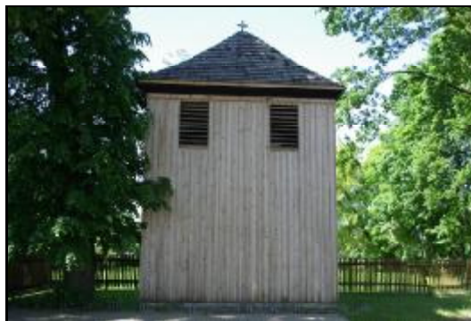
Fot.55-56. Dzwonnica przy kościele parafialnym p.w. Zwiastowania Najświętszej Maryi Panny w Izdebnie Kościelnym