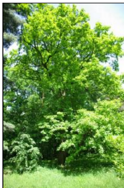
Fot.41-42. Park w zespole dworskim w Adamowiźnie