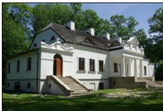
Fot.77-78. Dwór w zespole dworskim w Radoniach