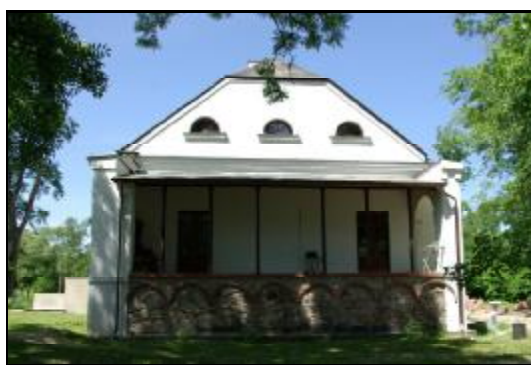
Fot.79-80. Dwór w zespole dworskim w Radoniach