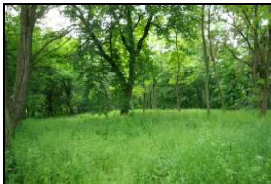
Fot.49-50 Park w zespole dworskim w Chlebni