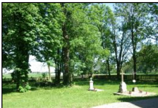
Fot.53-54. Kościół parafialny p.w. Zwiastowania Najświętszej Maryi Panny w Izdebnie Kościelnym