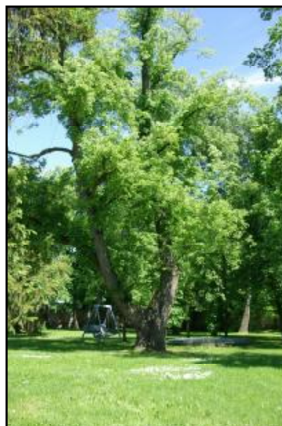
Fot.75-76. Park w zespole dworskim w Opypach