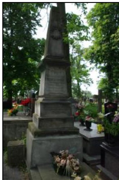
Fot.91-92. Cmentarz rzymsko-katolicki w Żukowie