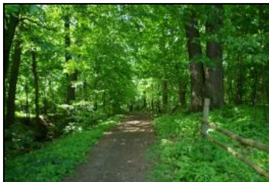
Fot.39-40. Park w zespole dworskim w Adamowiźnie