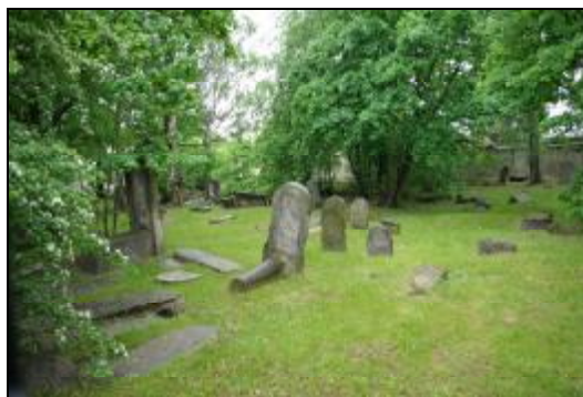
Fot.7-8 Cmentarz żydowski w Grodzisku Mazowieckim