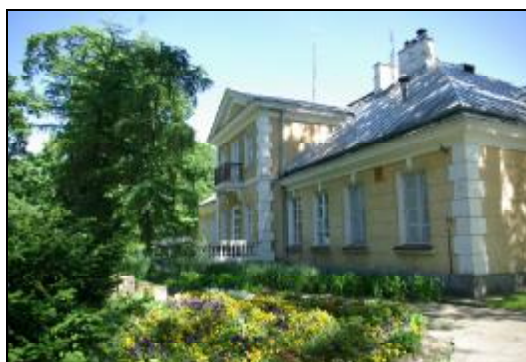
Fot.59-60. Dwór w zespole dworskim w Izdebnie Kościelnym