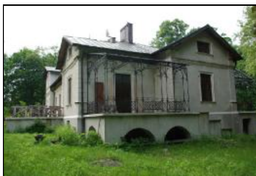
Fot.19-20. Willa „Kaprys” w Grodzisku Mazowieckim