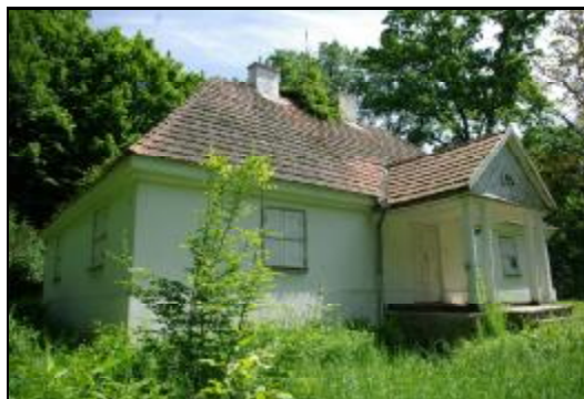
Fot.37-38. Dwór w zespole dworskim w Adamowiźnie