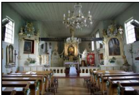
Fot.103. Wnętrze Kościoła. p.w. Przemienienia Pańskiego w Żukowie