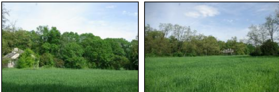
Fot.63-64. Park w Kludzienku