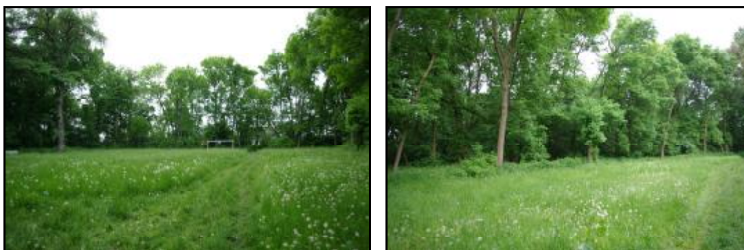
Fot.65-66. Park w Kraśniczej Woli