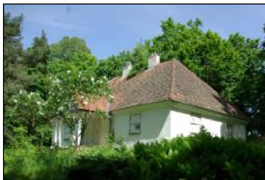
Fot.35-36. Dwór w zespole dworskim w Adamowiznie