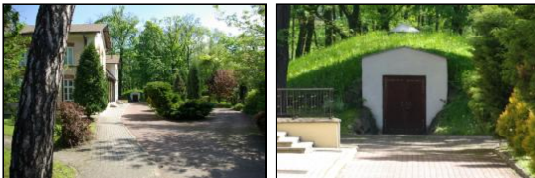
Fot.15-16 Budowla podziemna przy dworcu kolei warszawsko-wiedeńskiej w Grodzisku Mazowieckim