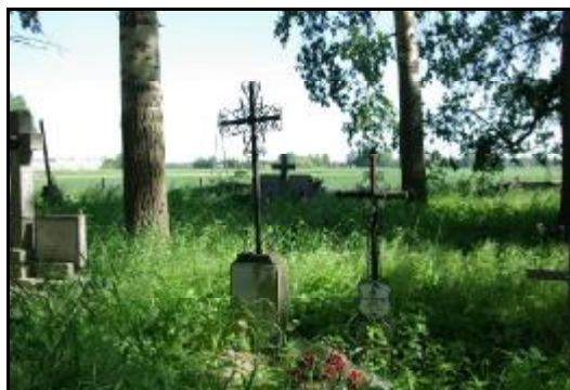
Fot.57-58. Cmentarz rzymsko-katolicki parafii p.w. św. Michała Archanioła w Izdebnie Kościelnym