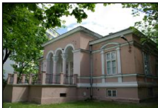
Fot.29-30. Pałacyk przy ul. Sienkiewicza 31 w Grodzisku Mazowieckim