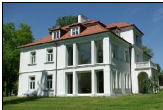
Fot.69-70. Dwór w zespole dworskim w Opykach