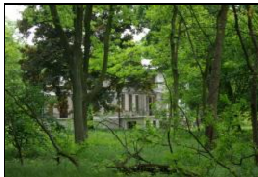
Fot.21-22. Willa „Kaprys” w Grodzisku Mazowieckim