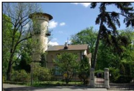
Fot.13-14. Dawny dworzec kolei warszawsko-wiedeńskiej w Grodzisku Mazowieckim