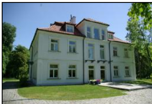
Fot.71-72. Dwór w zespole dworskim w Opykach