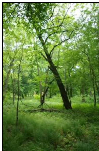
Fot.27-28. Park w zespole willowym „Kaprys” w Grodzisku Mazowieckim