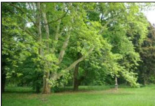
Fot.25-26. Park w zespole willowym „Kaprys” w Grodzisku Mazowieckim