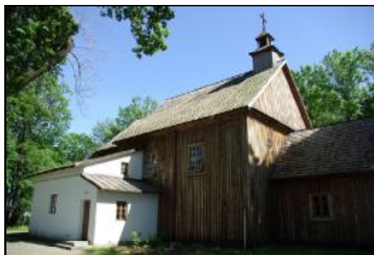
Fot.51-52. Kościół parafialny p.w. Zwiastowania Najświętszej Maryi Panny w Izdebnie Kościelnym