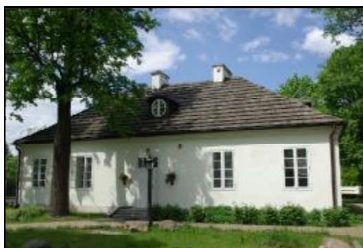
Fot.31-32. Dwór „Dom Skarbka” w Grodzisku Mazowieckim