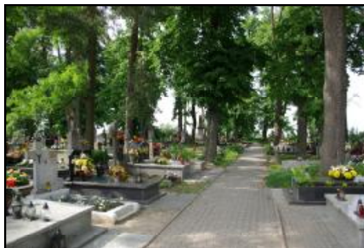
Fot.93-94. Cmentarz rzymsko-katolicki w Żukowie