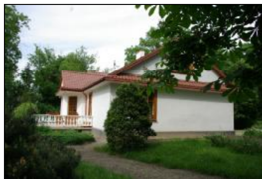
Fot.95-96. Dwór w zespole dworskim w Żukowie