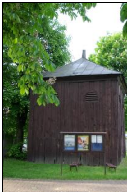
Fot.89-90. Dzwonnica przy kościele p.w. Przemienienia Pańskiego w Żukowie