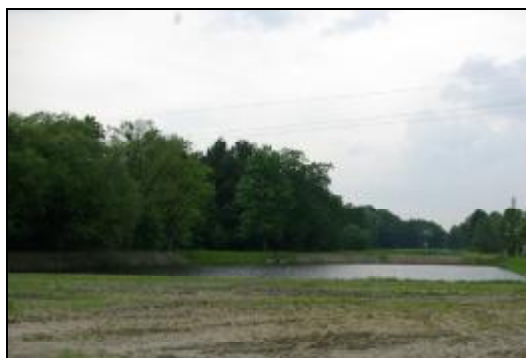
Fot.67-68. Park w Książenicach