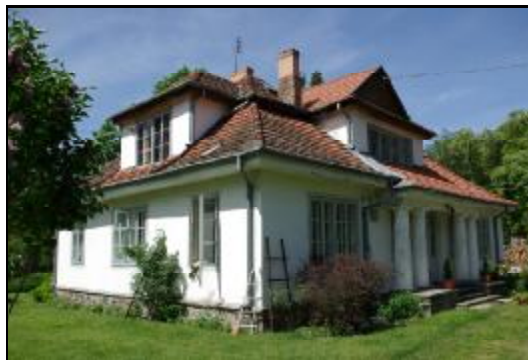
Fot.43-44. Willa z ogrodem w Adamowiznie