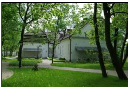
Fot.33-34. Dwór „Dom Skarbka” w Grodzisku Mazowieckim