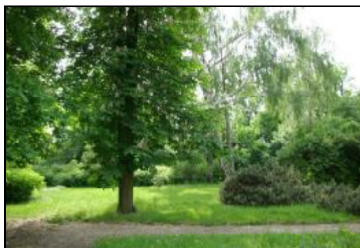
Fot.99-100. Park w zespole dworskim w Żukowie