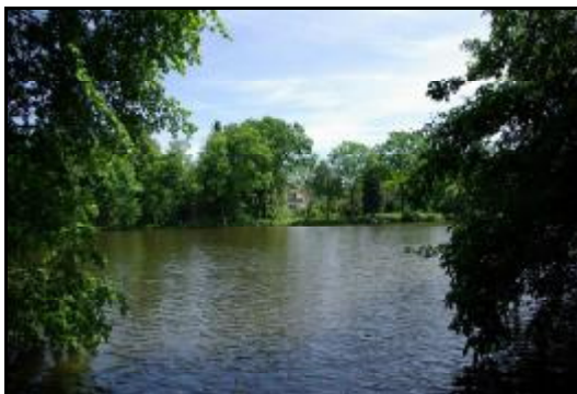
Fot.45-46. Willa z ogrodem w Adamowiznie